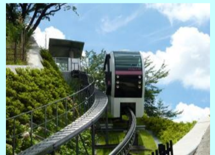
日本一短いモノレール アスカルゴ(飛鳥山公園内)